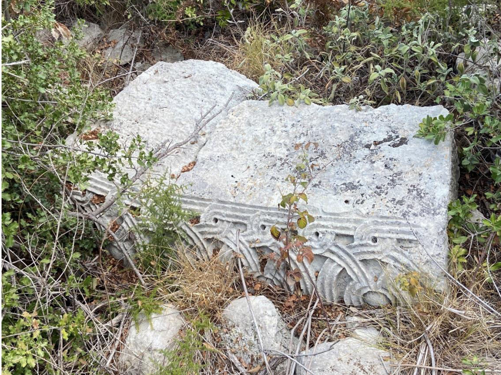
9. „ძელი ცხორების“ ტაძარი. ორნამენტული შემკულობის დეტალი 2025 წლის, 15 აგვისტო