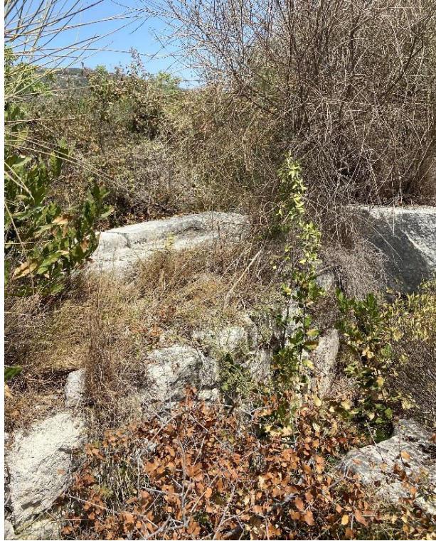
4. „ძელი ცხორების“ ტაძრის ნაშთები 2025 წლის, 15 აგვისტო