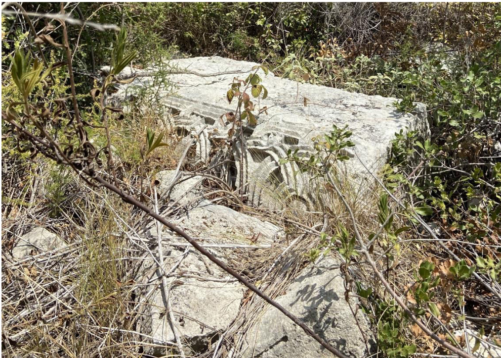
10. „ძელი ცხორების“ ტაძარი. ორნამენტული შემკულობის დეტალი 2025 წლის, 15 აგვისტო