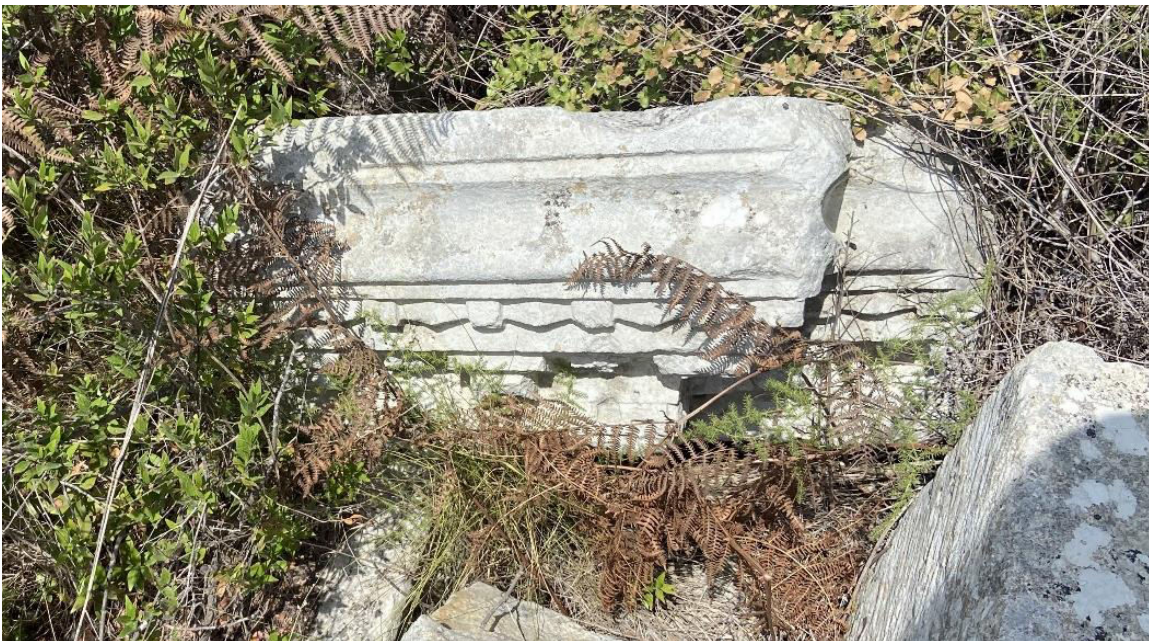
8. „ძელი ცხორების“ ტაძარი. ორნამენტული შემკულობის დეტალი 2025 წლის, 15 აგვისტო (Djobadze, Wachtang (1986), Plate 66, fig. 255)