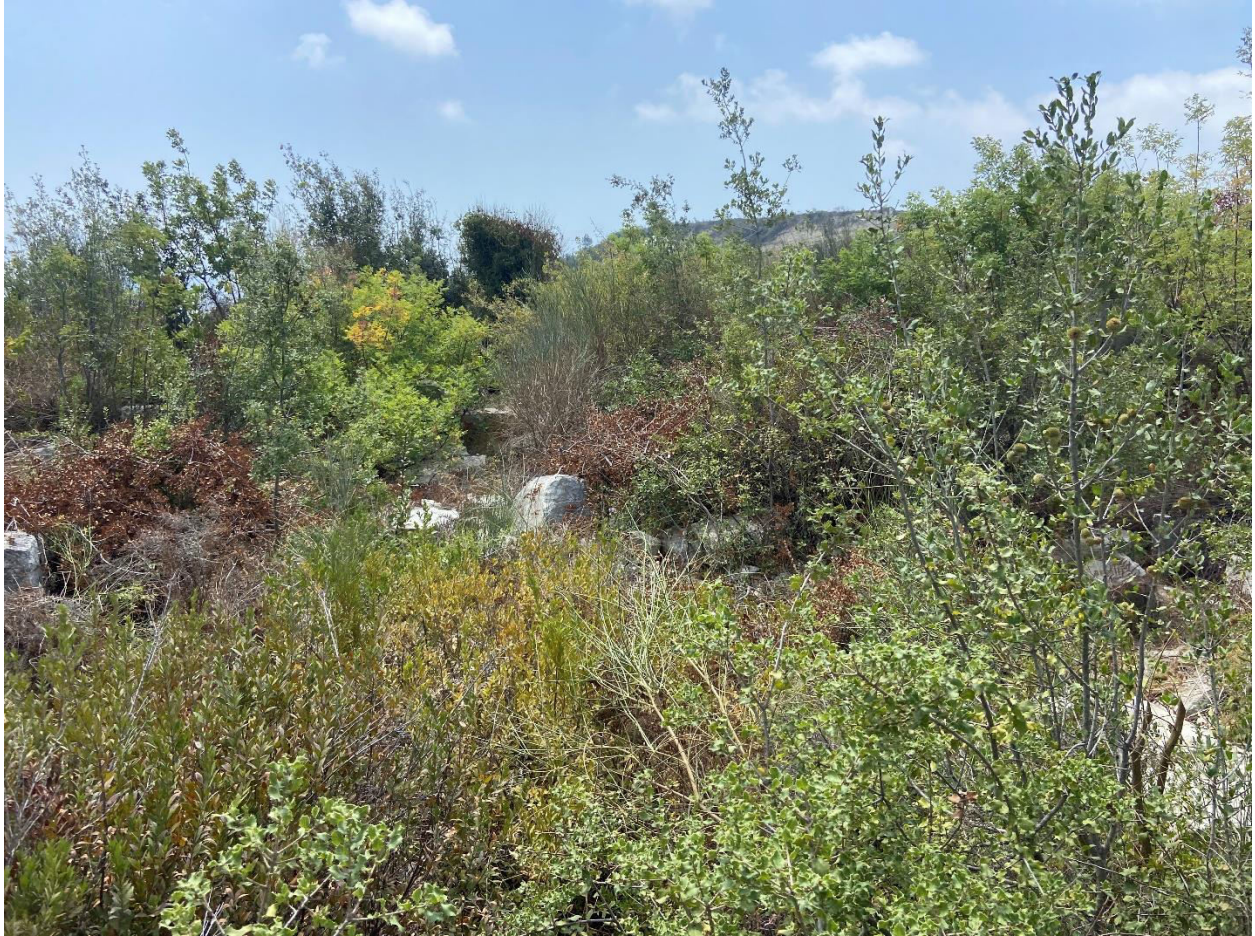
ნ. „ძელი ცხორების“ ტაძრის ნაშთები, შიდა სივრცე 2025 წლის, 15 აგვისტო