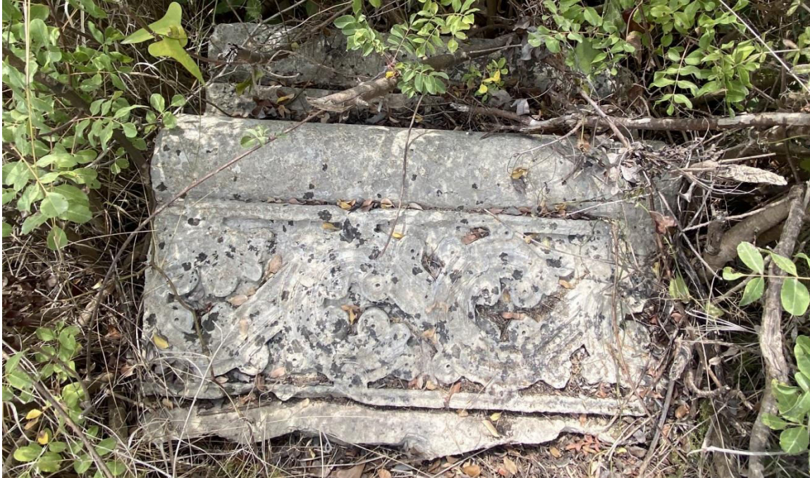
7. „ძელი ცხორების“ ტაძარი. ორნამენტული შემკულობის დეტალი 2025 წლის, 15 აგვისტო (Djobadze, Wachtang (1986), Plate 76)