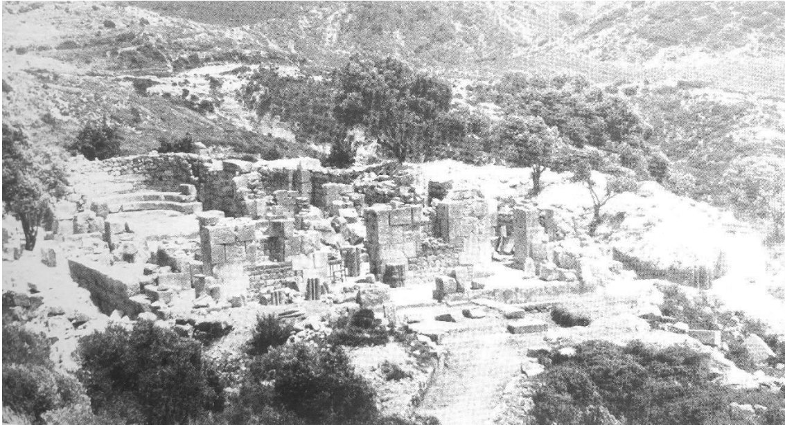
1. „ძელი ცხორების“ ტაძრის საერთო ხედი. ვახტანგ ჯობაძის მასალები (Djobadze, Wachtang (1986), Plate 59, fig. 232)