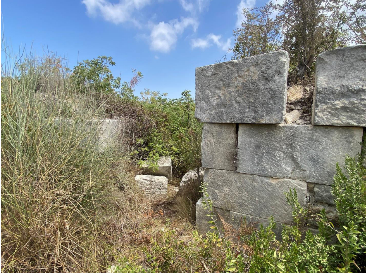
3. „ძელი ცხორების“ ტაძრის ნაშთები 2025 წლის, 15 აგვისტო