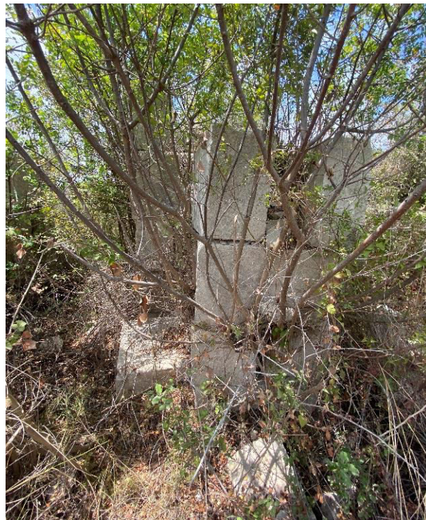
5. „ძელი ცხორების“ ტაძრის ნაშთები 2025 წლის, 15 აგვისტო