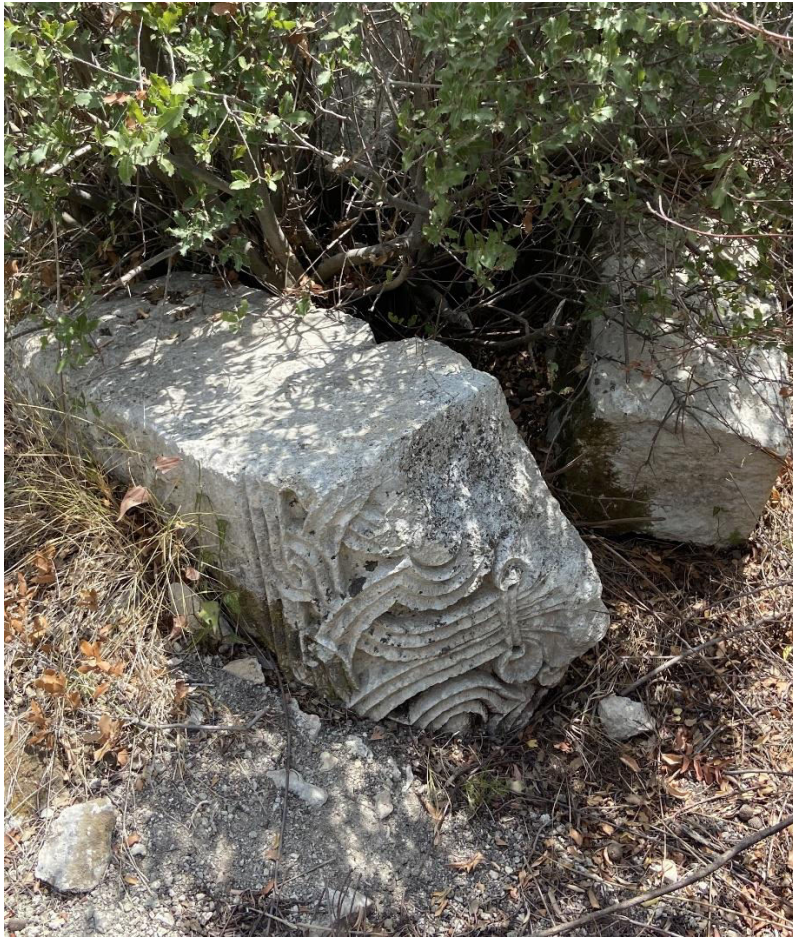
11. „ძელი ცხორების“ ტაძარი. ორნამენტული შემკულობის დეტალი 2025 წლის, 15 აგვისტო (Djobadze, Wachtang (1986), Plate 65, fig. 248)