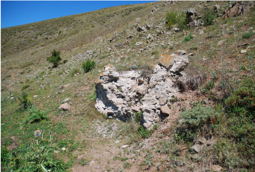
ილ. 8. ღვინია, თანამედროვე სოფელი იოზბაშის (Özbaşı), ძველი წყაროს ნაგებობის ფრაგმენტები ეკლესიის დასავლეთით