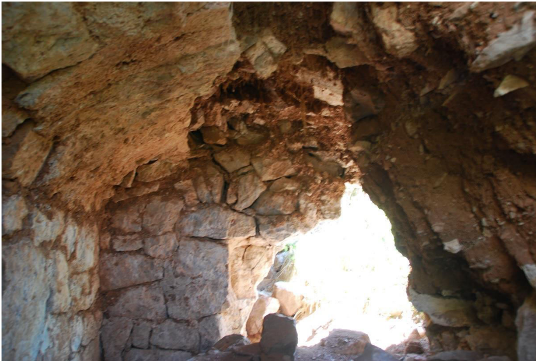
ილ. 5. ღვინია, თანამედროვე სოფელი იოზბაშის (Özbaşı), ჩრდილოეთი მინაშენი, კამარა, ტიხარი და ჩამოქცეული ნაწილი