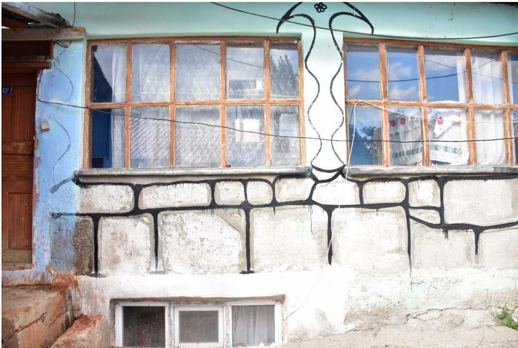
ილ. 11. ღვინია, თანამედროვე სოფელი იოზბაშის (Özbaşı), სოფელში მდებარე სახლი N42ა, კედელში ჩაშენებული წარწერიანი ქვა