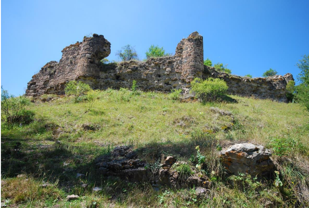
ილ. 14. ღვინია, თანამედროვე სოფელი იოზბაშის (Özbaşı), ციხის აღმოსავლეთი კედელი, მოპირკეთების ქვები და გოდოლთა შვერილები