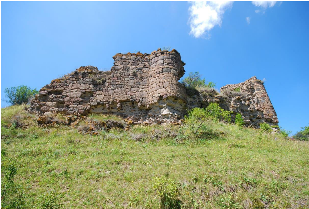
ილ. 13. ღვინია, თანამედროვე სოფელი იოზბაშის (Özbaşı), ციხე, აღმოსავლეთი კედელი, გოდოლისა და წყობის ნაწილები