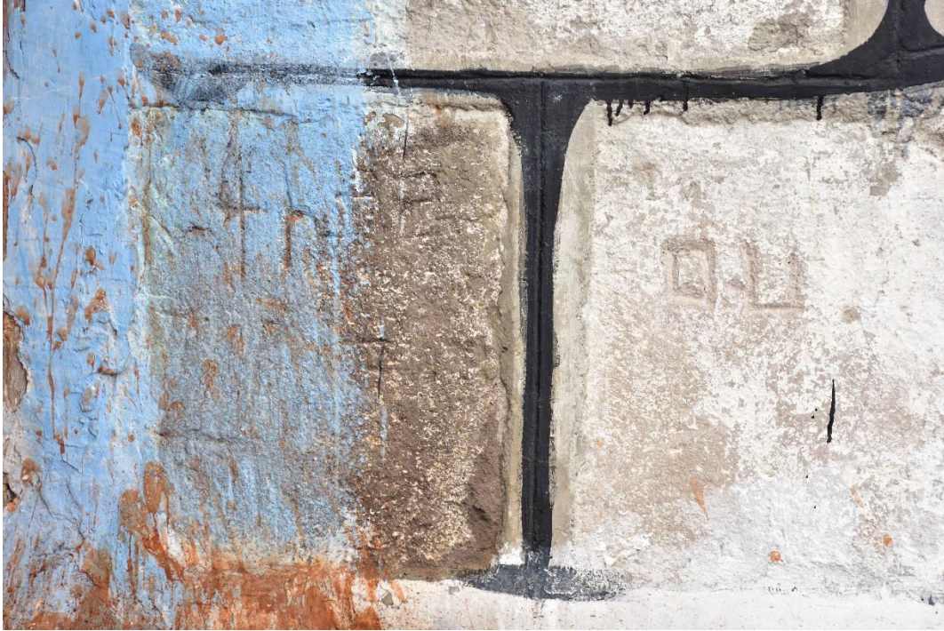
ილ. 12. ღვინია, თანამედროვე სოფელი იოზბაშის (Özbaşı), სახლის კედელში ჩატანებული ქვა ასომთავარული წარწერით