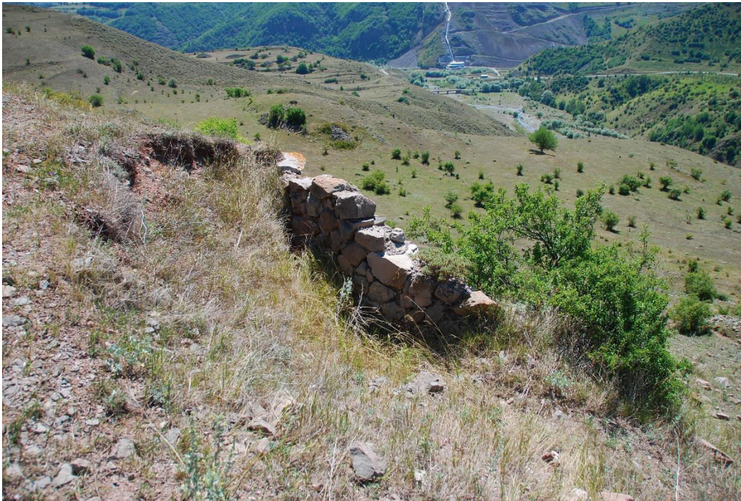
ილ. 7. ღვინია, თანამედროვე სოფელი იოზბაშის (Özbaşı), ტაძრის სამხრეთ-აღმოსავლეთით არსებული კედლის ფრაგმენტები