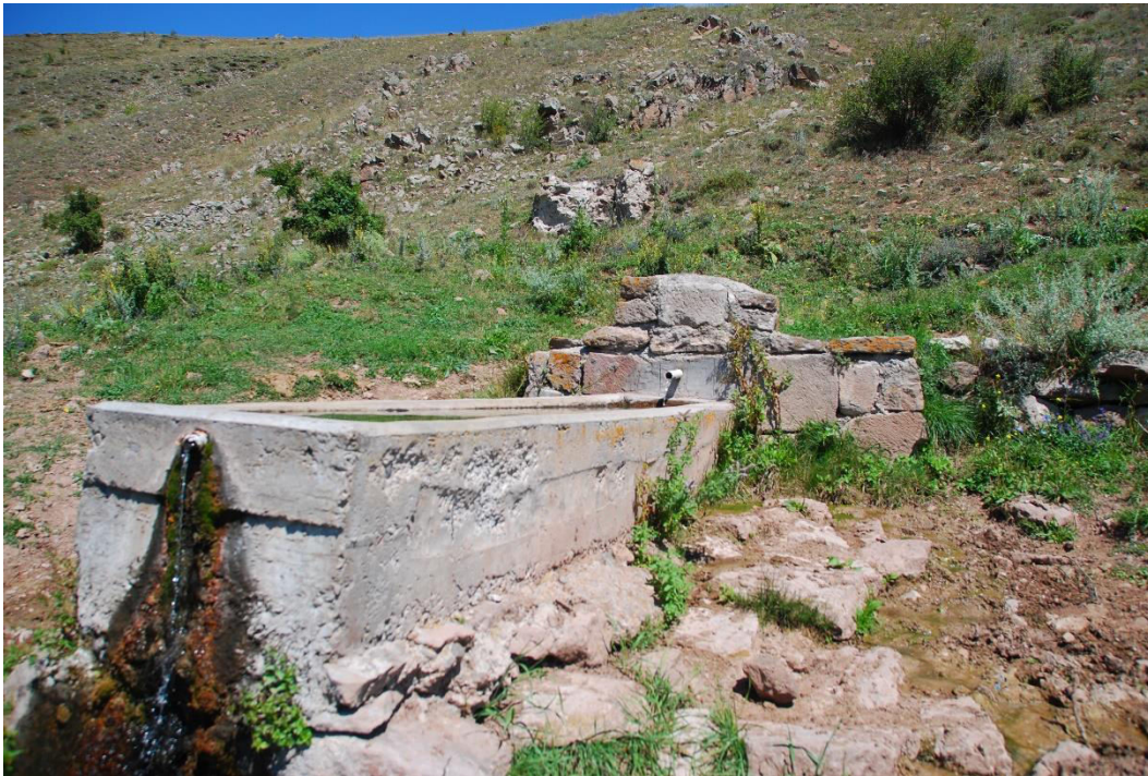
ილ. 9. ღვინია, თანამედროვე სოფელი იოზბაშის (Özbaşı), ახალი წყარო, ძველის ნანგრევების სიახლოვეს