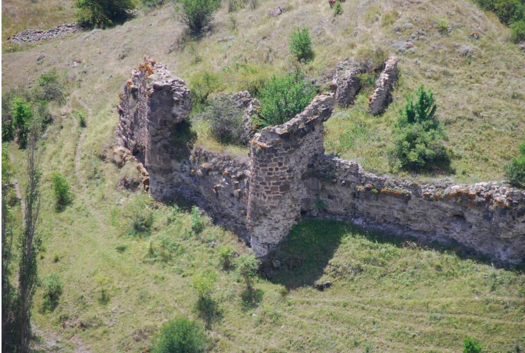
ილ. 17. ღვინია, თანამედროვე სოფელი იოზბაშის (Özbaşı), ციხე, ზედხედი, ციხის ცენტრალური კედლები და შიდა გეგმარებითი ელემენტები