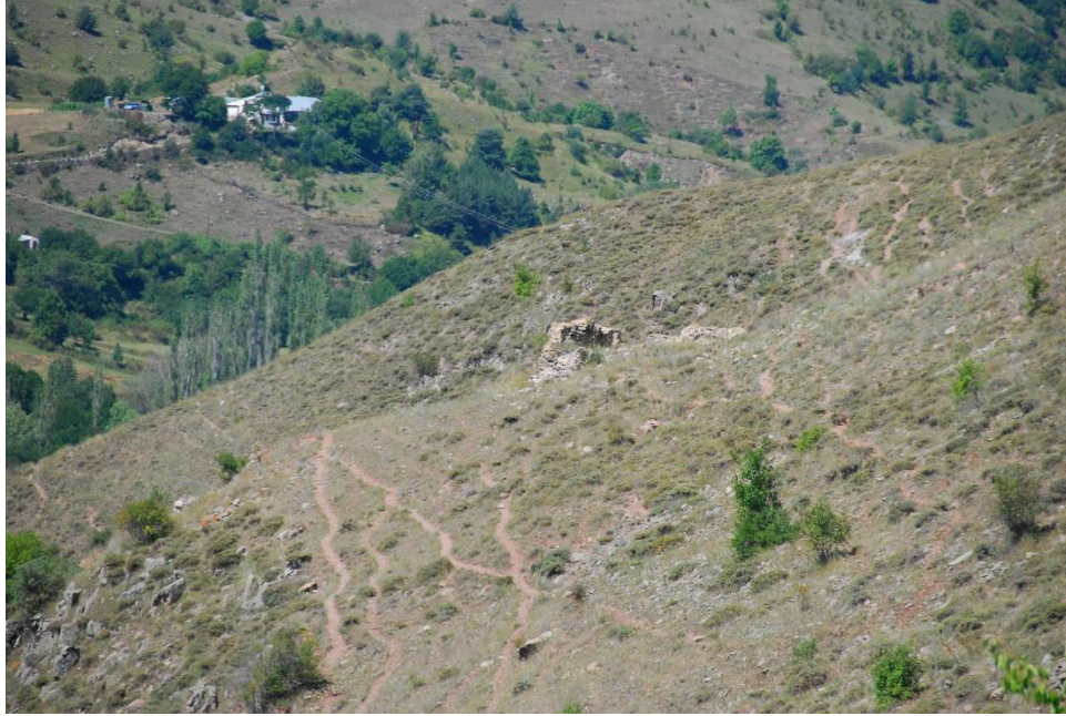
ილ. 1. ღვინია, თანამედროვე სოფელი იოზბაშის (Özbaşı), მთის ფერდზე აგებული ეკლესია საერთო ხედი