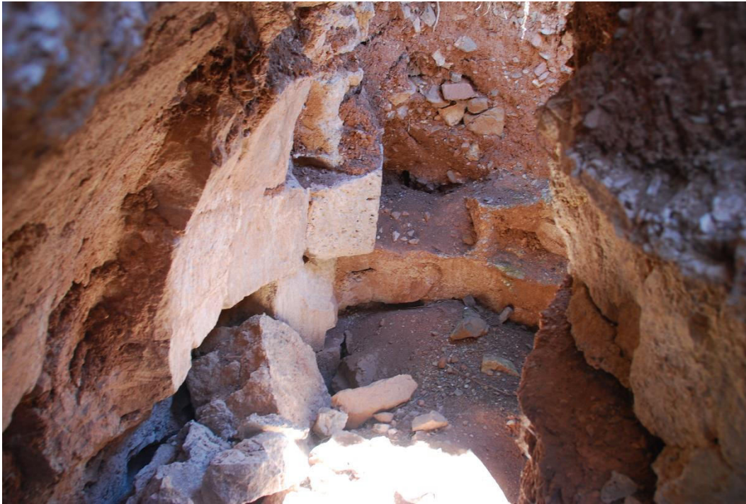
ილ. 6. ღვინია, თანამედროვე სოფელი იოზბაშის (Özbaşı), ჩრდილოეთი მინაშენი, საკურთხევლის აფსიდი და მისი მოპირკეთების ქვები