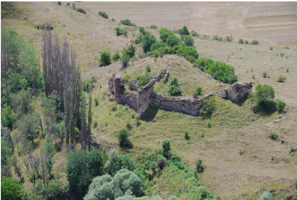
ილ. 16. ღვინია, თანამედროვე სოფელი იოზბაშის (Özbaşı), ციხე, საერთო ხედი, ძეგლის კონტური, გეგმარება და გოდოლთა არეები