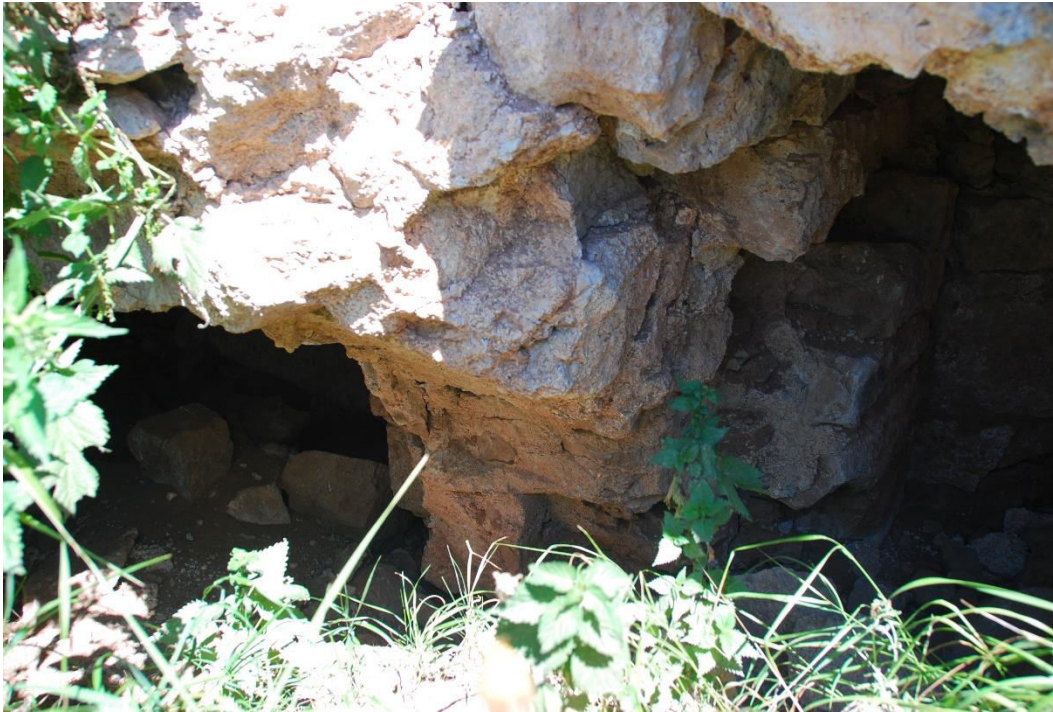
ილ. 4. ღვინია, თანამედროვე სოფელი იოზბაშის (Özbaşı), ჩრდილოეთი მინაშენი და მის სივრცეში არსებული ტიხარი