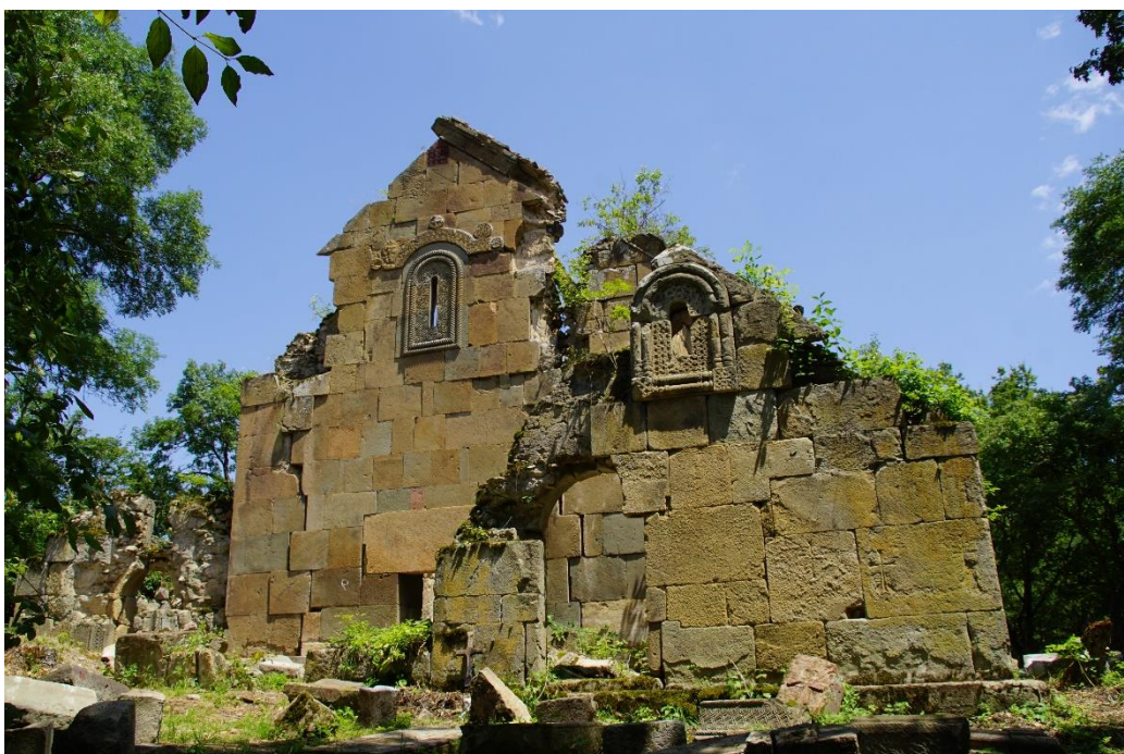
Fig. 1 Satkhe St. Kvirike Church