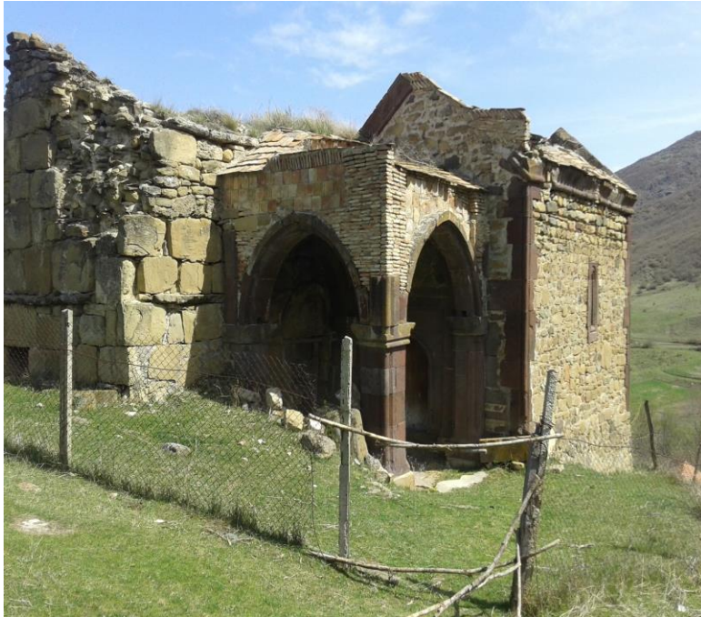
ილუსტრაცია N2 კოშკების ღვთისმშობლის სამხრეთი ფასადი