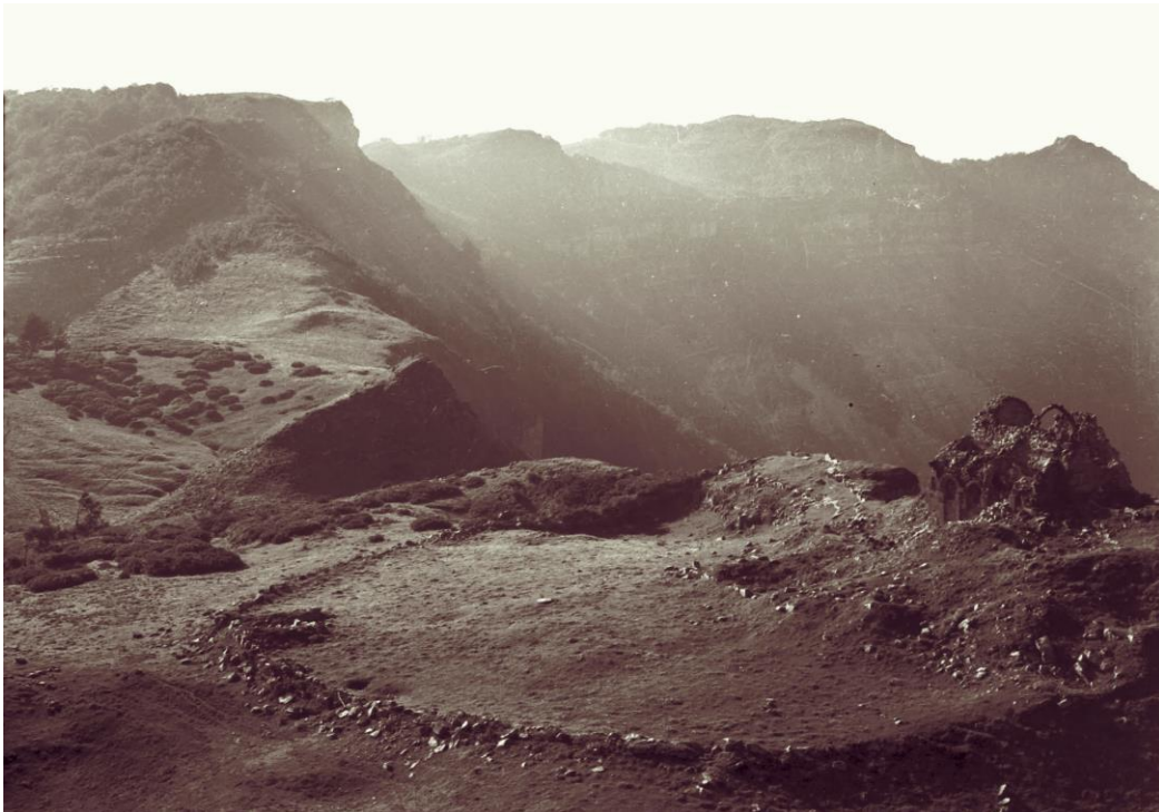
მთის წმ. გიორგის მონასტერი, ხედი ჩრდ-დას-დან, მ. დვალის ფოტო, 1954 წ.

მთის წმ. გიორგის მონასტერი, რომელიც დღეს ლეკნარის, ასევე „მთასაყდარის“ სახელწოდებებითაა ცნობილი სამეცნიერო ლიტერატურაში, ქვემო რაჭაში, რაჭის ქედის სამხრეთ კალთაზე, მაღალ კლდეზეა გაშენებული და თარიღდება დაახლოებით IX ს-ის II ნახევრიდან X ს-ის I ნახევრით, მთავარი ნავის ჩრდილოეთ მინაშენი X ს-ის დასასრულით ან XI ს-ის პირველი მესამედით, დასავლეთ მინაშენი კი უფრო მოგვიანო პერიოდით (ბოჭორიძე, 1995: 85-90; დვალი, ლეკნარის წმ. გიორგის ეკლესია, 1968: 155-165). მონასტრის კოორდინატებია - 42°26'10.45"; 42°58'32.15“.