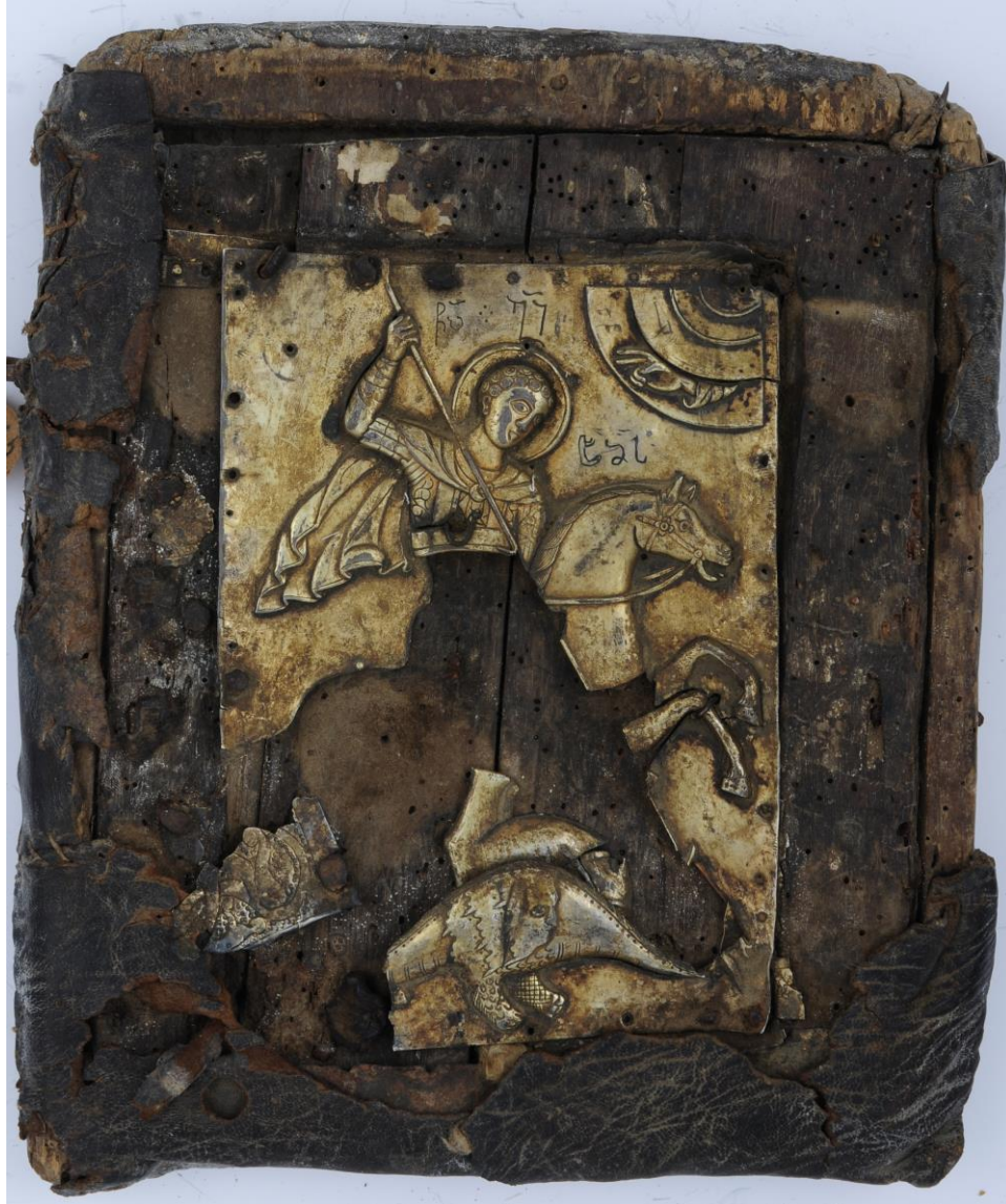
ქუთაისის სახელმწიფო ისტორიული მუზეუმი, #3168/565 (ძვ. #2872).