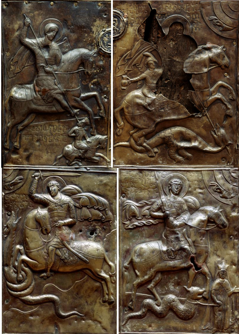
სადგერის საკურთხეველისწინა ჯვარი, 1522/3-1534 წწ., წმ. გიორგის სცენები (საქართველოს ხელოვნების მუზეუმი, 1173-76)

მსგავსებები ისეთი დეტალებისა, როგორებიცაა წმ. გიორგის მოსასხამი, აბჯარი, სახე (განსაკუთრებით თვალები, ცხვირი და პირი), ცხენის ფაფარი, ლაგამი, ოთხად გახსნილი ზეცა და მაკურთხეველი მარჯვენა, იმდენად დიდი იყო, ამან უკვე შემიქმნა შთაბეჭდილება, რომ შესაძლებელი იყო მთის წმ. გიორგის მონასტრის ეს ხატიც მამნე ოქრომჭედლის მოჭედილი ყოფილიყო. ეს ვარაუდი კი უკვე დასკვნად აქცია წმ. გიორგის მიერ ბოლღარელი ყრმის დახსნის სცენაზე გველეშაპის ვიზუალმა და იმ გამორჩეულმა იკონოგრაფიულმა დეტალმა, რაც მას ახლავს: გველეშაპის ტანზე, ფრთაში შერწყმული ადამიანის პროფილი (ჩხარტიშვილი, 1978: 68-69), რომელიც, როგორც ზემოთ უკვე ითქვა, მთის წმ. გიორგის მონასტრის ხატზეც გვხვდება.