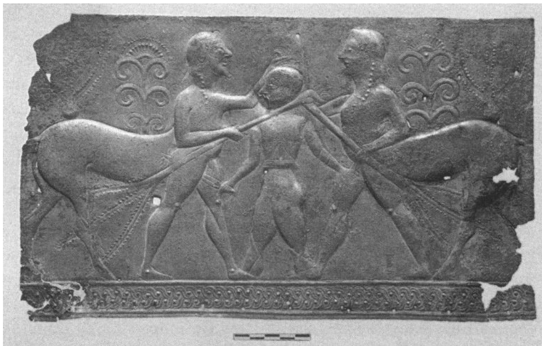
სურათი 1: ბრინჯაოს რელიეფი ოლიმპიიდან, ca. ძვ. წ. 630 წ. ოლიმპია, არქეოლოგიური მუზეუმი, ინვენტარის ნომერი BE 11a.