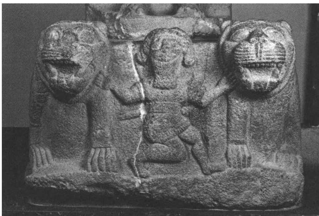
სურათი 4: ბაზალტის რელიეფი სალამიდან, ადრეული ძვ. წ. მე-9 ს. სტამბოლი, ანტიკური აღმოსავლეთის მუზეუმი, ინვენტარის ნომერი 7768.