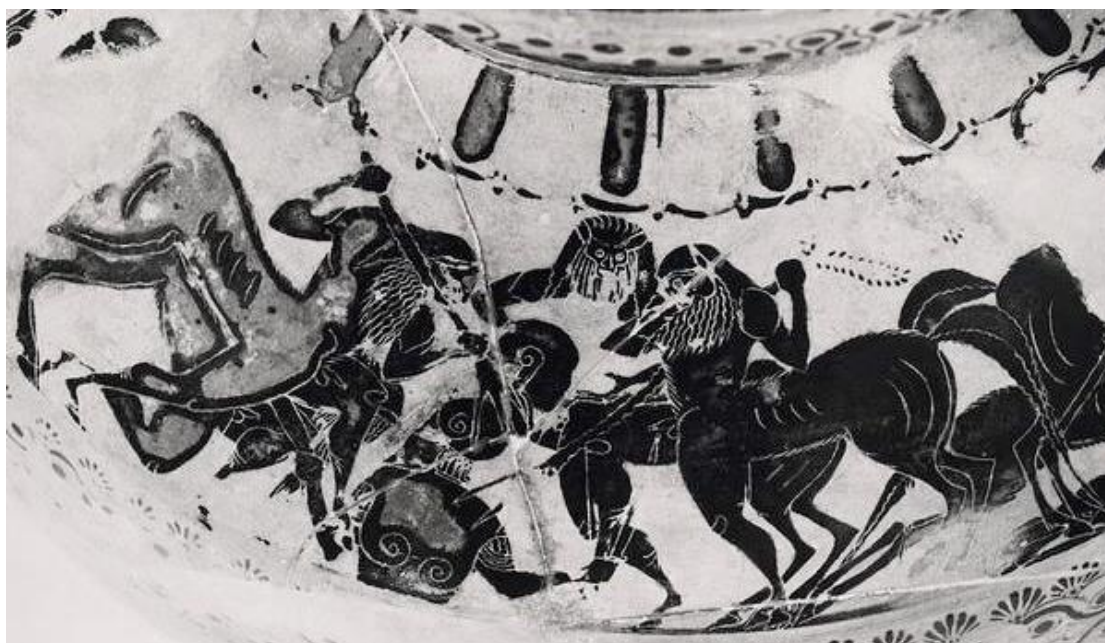
სურათი 2: შავფიგურული ჰიდრია, ca. ძვ. წ. 530 წ. ბონი, ხელოვნების მუზეუმი, ინვენტარის ნომერი V 2674.