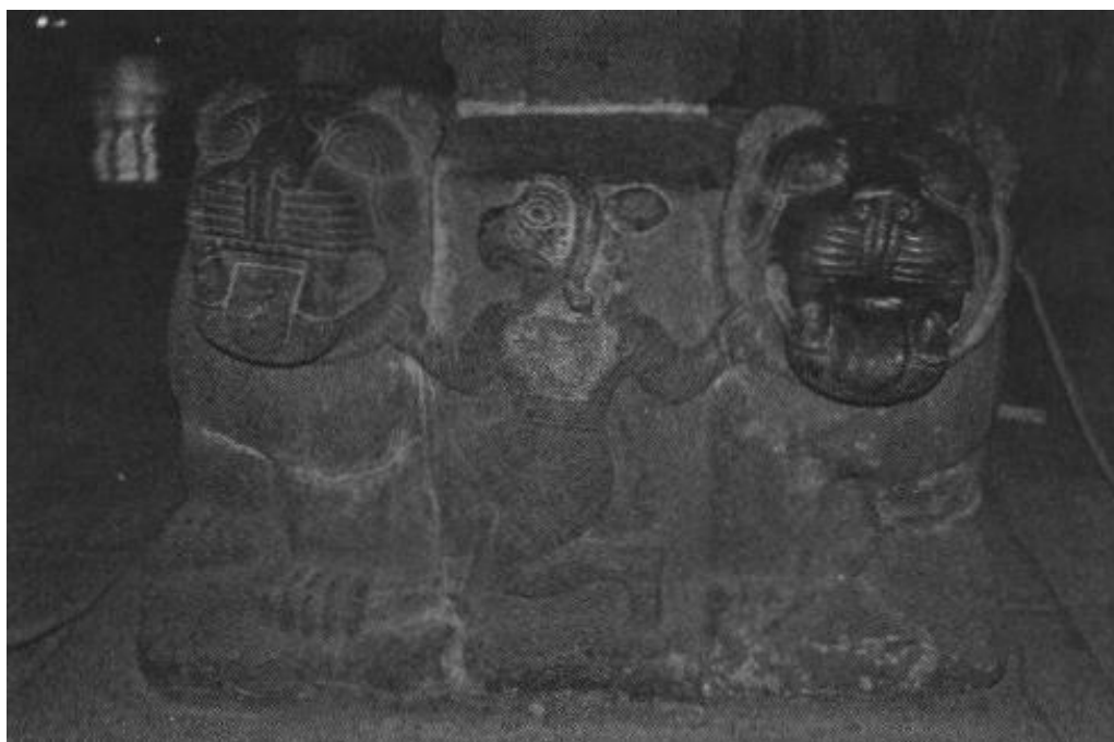
სურათი 5: ბაზალტის რელიეფი ქარხემიშიდან, ადრეული ძვ. წ. მე-9 ს. ანკარა, ანატოლიურ ცივილიზაციათა მუზეუმი, ინვენტარის ნომერი 69a+b+c. ფოტო: Shamugia, N. 2017. "A bronze relief with Caeneus and Centaurs from Olympia." Harvard Studies in Classical Philology , 109, 31-61, გვ. 43, სურ. 4.