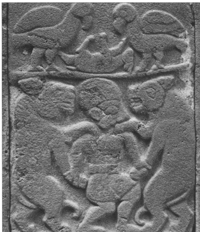
სურათი 3: ბაზალტის რელიეფი კარატეპედან, ca. ძვ. წ. 700 წ. In situ . ფოტო: Shamugia, N. 2017. "A bronze relief with Caeneus and Centaurs from Olympia." Harvard Studies in Classical Philology , 109, 31-61, გვ. 41, სურ. 2.