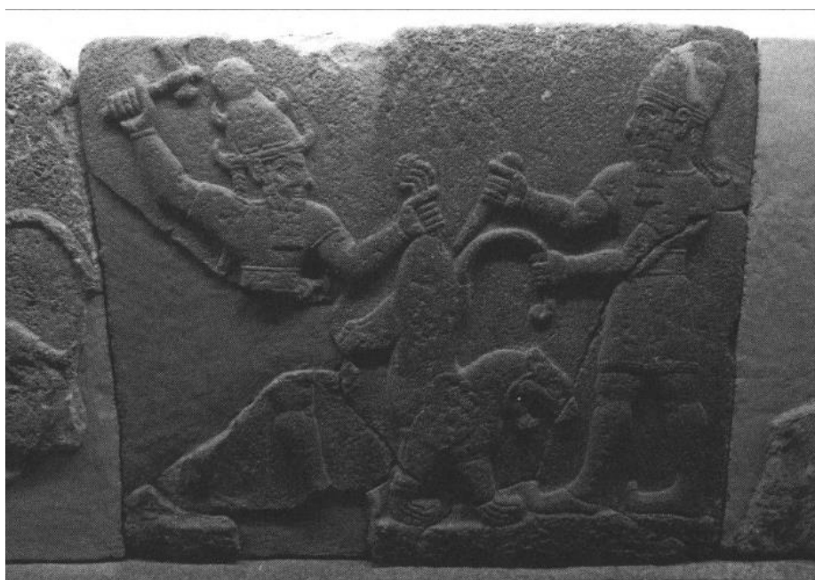
სურათი 8: ბაზალტის რელიეფი ქარხემიშიდან, ca. ძვ. წ. 915 – 885 წწ. ანკარა, ანატოლიურ ცივილიზაციათა მუზეუმი, ინვენტარის ნომერი 9666. ფოტო: Shamugia, N. 2017. “A bronze relief with Caeneus and Centaurs from Olympia.” Harvard Studies in Classical Philology , 109, 31-61, გვ. 48, სურ. 7.