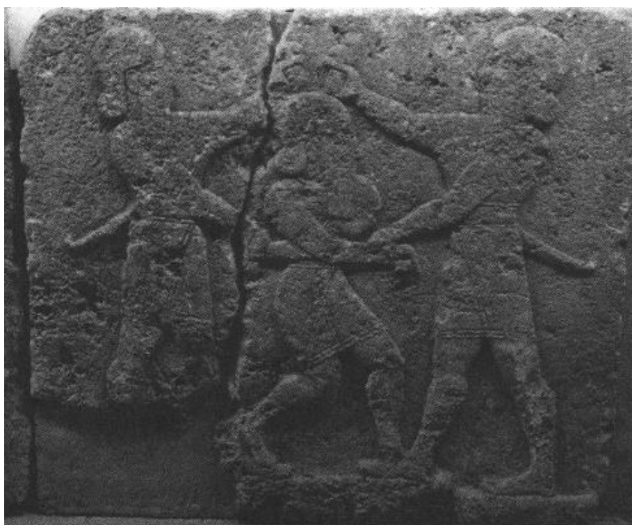
სურათი 6: კირქვის რელიეფი ქარხემიშიდან, ადრეული ძვ. წ. მე-10 ს. ანკარა, ანატოლიურ ცივილიზაციათა მუზეუმი, ინვენტარის ნომერი 77.