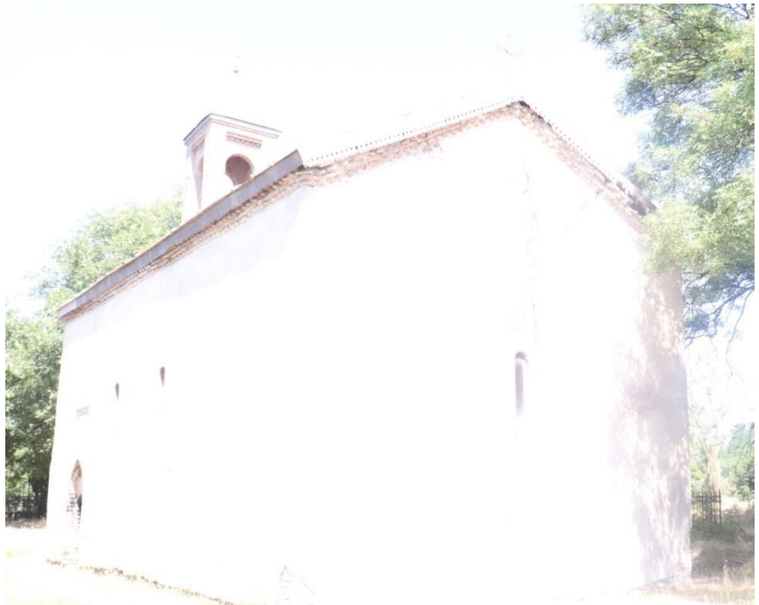
ქვემო ხვითის წმ. ღვთისმშობლის ეკლესია (ხედი სამხრეთ-აღმოსავლეთიდან)