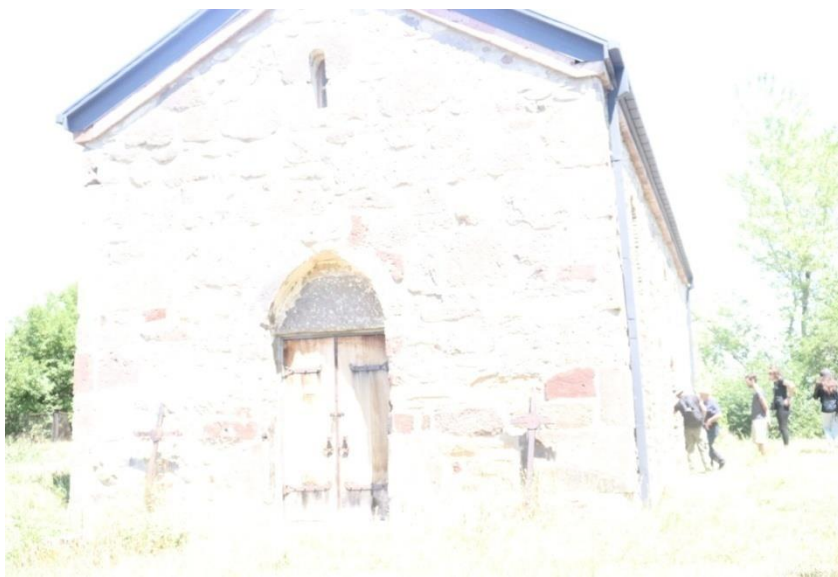
ქვემო ხვითის წმ. გიორგის ეკლესია (ხედი სამხრეთ-დასავლეთიდან)

წმინდა გიორგის ეკლესია დგას სოფლის განაპირას, აღმოსავლეთით. სავარაუდოდ, თარიღდება გვიან ფეოდალური ხანით. დარბაზულია (12,2X7,2მ.). ნაგებია ნატეხი ქვით. შენობის კუთხეები, კარის და სარკმლის საპირეები ტუფის ქვისაა. სახურავი ორფერდაა, გადახურულია ღარიანი კრამიტით. ეკლესია დასავლეთის მხრიდან მიდგმული აქვს კვადრატული აგურით ნაშენი ორიარუსიანი, ოთხ სვეტზე დაყრდნობილი სამრეკლო [საქართველოს, (V) 1990:70].