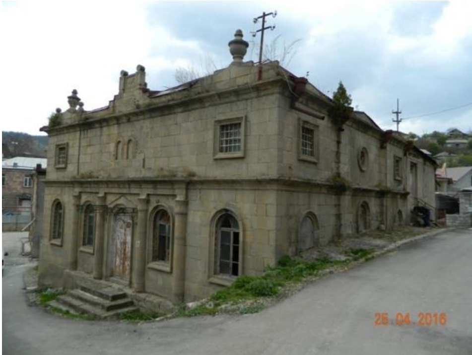
1902 წელს აგებული გაუქმებული სალოცავის ხედი