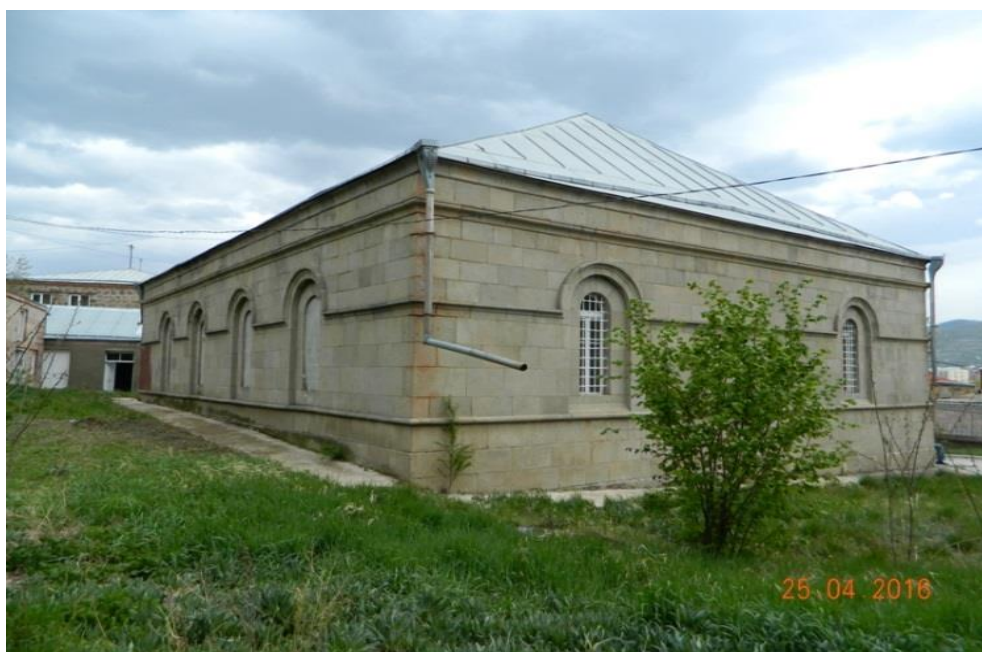
ახალციხის მოქმედი სინაგოგა