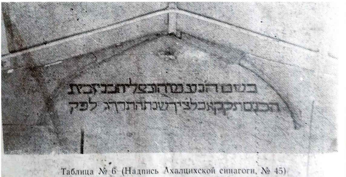
ნისან ბაბალიკაშვილის მიერ გადაღებული ახალციხის სინაგოგის წარწერის ფოტო 1971 წელი (ანალოგიური წარწერა)