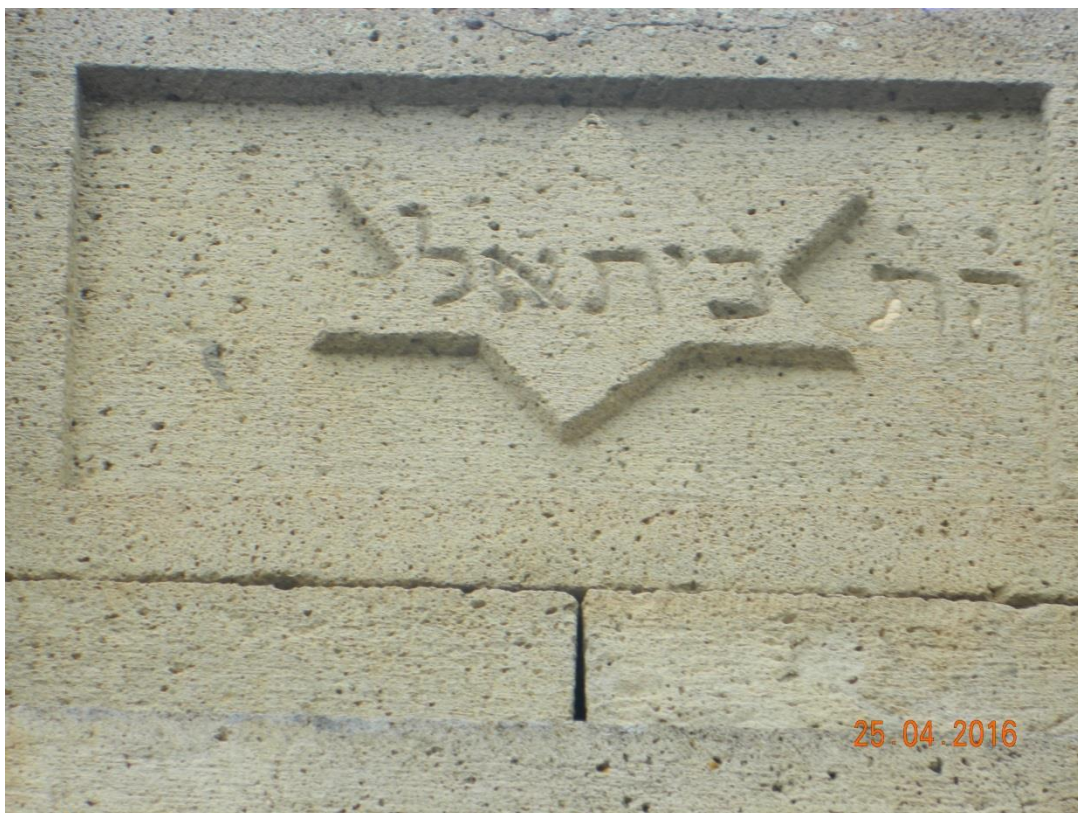
1902 წელს აშენებული მეორე, გაუქმებული სინაგოგის სამშენებლო წარწერა